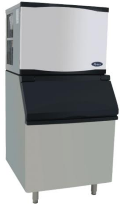
YR450-AP-161 con BIN CYR400P opcional