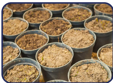
Fabricas de alimentos para mascotas