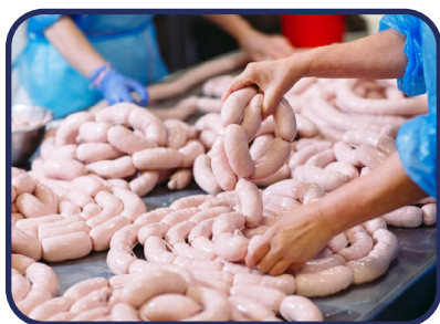
Fabricas de embutidos