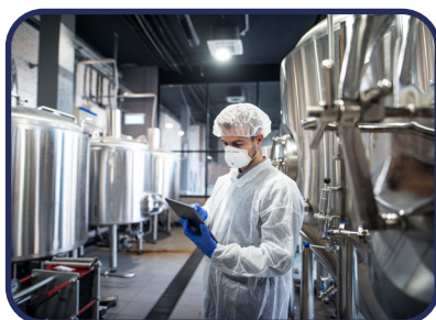
Plantas de procesamiento de alimentos