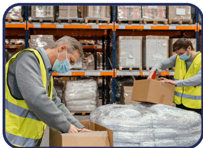
Bodegas de empaque