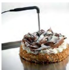
Sonda de núcleo

** Evap. -10 °C, cond. +45 °C*** ASHRAE (Evap. -23,3 °C, cond. +54,4 °C)