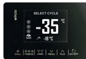
Panel de control con pantalla táctil