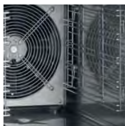
Detalle de la ventilación interna