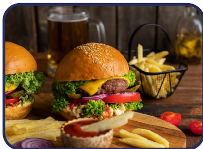
Cadenas de comida rápida