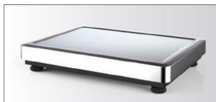
Plataforma ancha - para una carga fácil