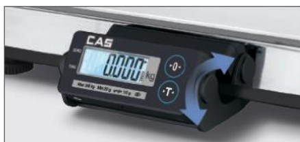
Alta visibilidad gracias a la pantalla LCD inclinable