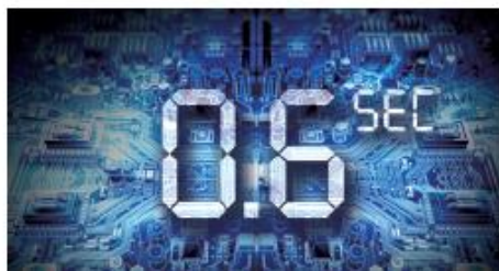
Operación Rápida y Alta Precisión