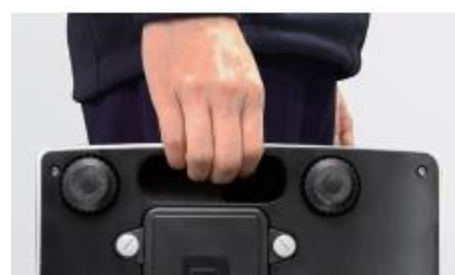
Fácil de Transportar o Llevar