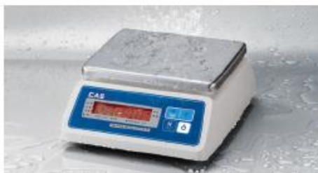
Apto para Ambiente Húmedo

SWII – W es una balanza a prueba de humedad que garantiza el uso estable y prolongado en entornos húmedos, como aplicaciones de procesamiento de todo tipo de alimentos, comercialización de pescados y mariscos. Además, es fácil de transportar y su tiempo de estabilización de menos de 0,6 segundos hace que su funcionamiento sea rápido y preciso.