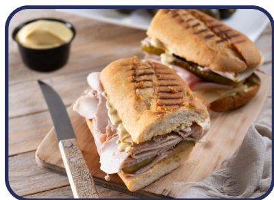
Panaderías y cafeterías