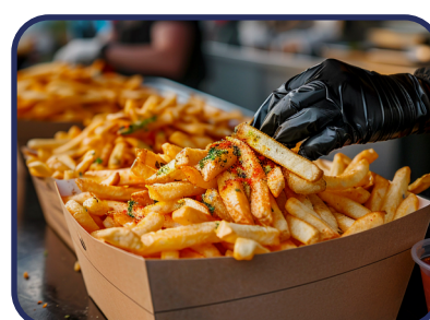
Restaurantes de comida rápida